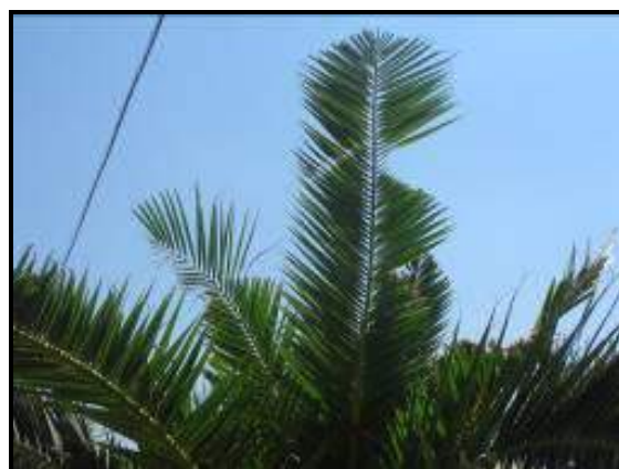
Fig. 3 Margini seghettati e rosure fogliari

Successivamente si ha un gradiente di danno sempre più intenso con la cima che si piega e la chioma che si appiattisce. La pianta, da un'osservazione a distanza, appare come appiattita.