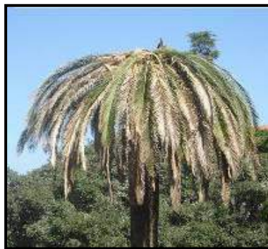
Fig. 5 Disseccamento generalizzato e appiattimento

L'esito finale dell'infestazione di Rhynchophorus ferrugineus sui vegetali di palma è la morte della pianta, la cui chioma presenta tutte le foglie secche e ripiegate verso il basso, in una tipica forma ad ombrello.