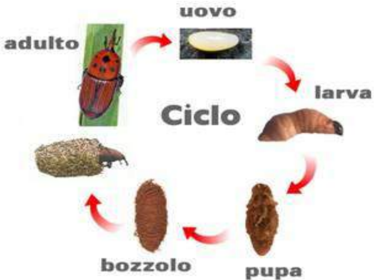
Fig. 2 Ciclo biologico del punteruolo

L'adulto del punteruolo presenta un colore rosso ferrugineo, da cui deriva il nome. Sulla parte superiore del torace sono evidenti striature nere di numero e forma variabili. La lunghezza dell'adulto può variare tra i 3 ed i 5 cm e la larghezza da 1 a 1,5 cm. Il capo è caratterizzato dalla presenza di un lungo rostro, su cui sono inserite 2 antenne e all'estremità del quale è presente l'apparato boccale. Nei maschi esso è lungo circa 1 cm ed è munito di una serie di fitte setole erette, mentre nelle femmine è privo di setole e leggermente più lungo ed arcuato.