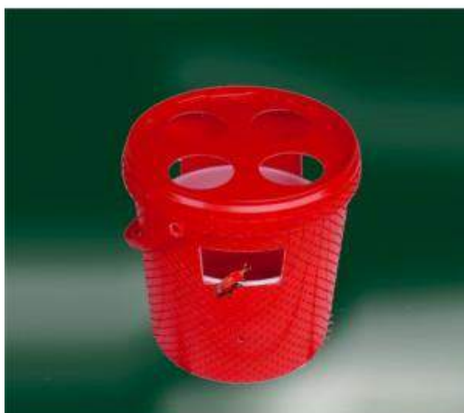
Fig. 1. Trappola a feromoni