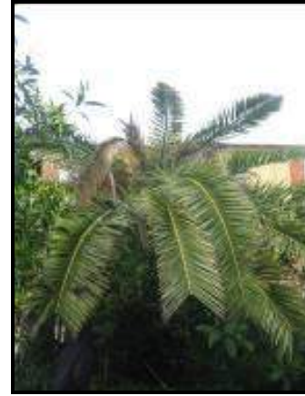
Fig. 4 Asimmetria della chioma e appiattimento

L'esito finale dell'infestazione di Rhynchophorus ferrugineus sui vegetali di palma è la morte della pianta, la cui chioma presenta tutte le foglie secche e ripiegate verso il basso, in una tipica forma ad ombrello.